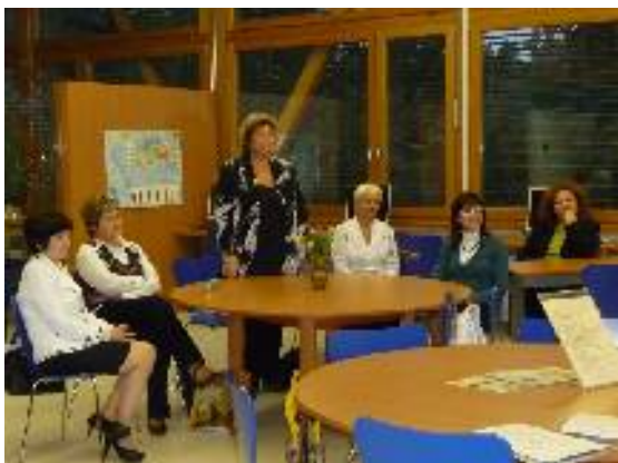
Krátký projev paní ředitelky před podpisem listiny přátelství