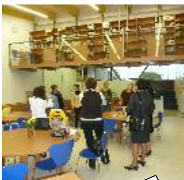
Knihovna s čítárnou