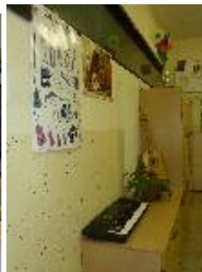
Učebna hudební výchovy