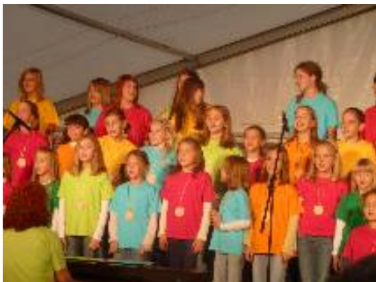
Ukázky ze školní akademie k 30.výročí založení školy