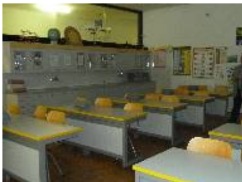
Učebna fyziky a chemie