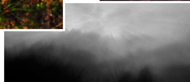
fotografie Jany Hrubé, které se umístily na 2. místě v soutěži Jaro v Brně