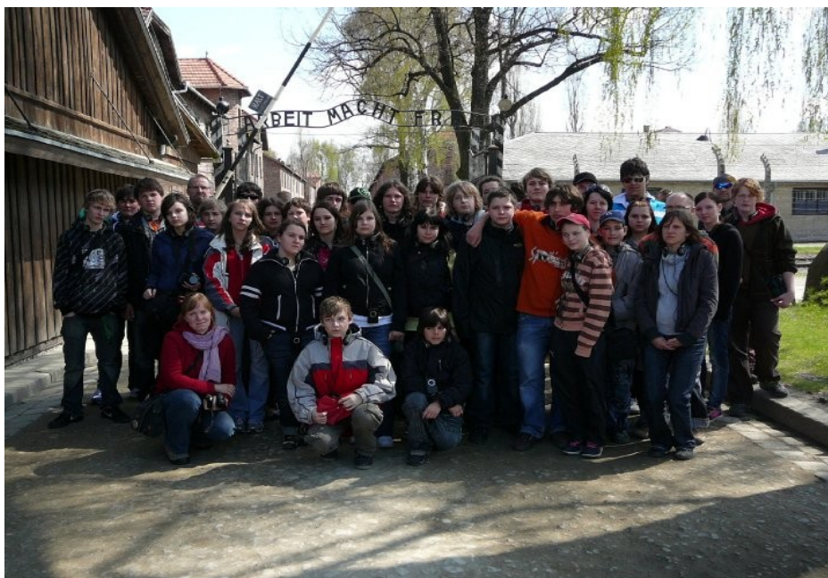
Skupinová fotka před branou Auschwitzu