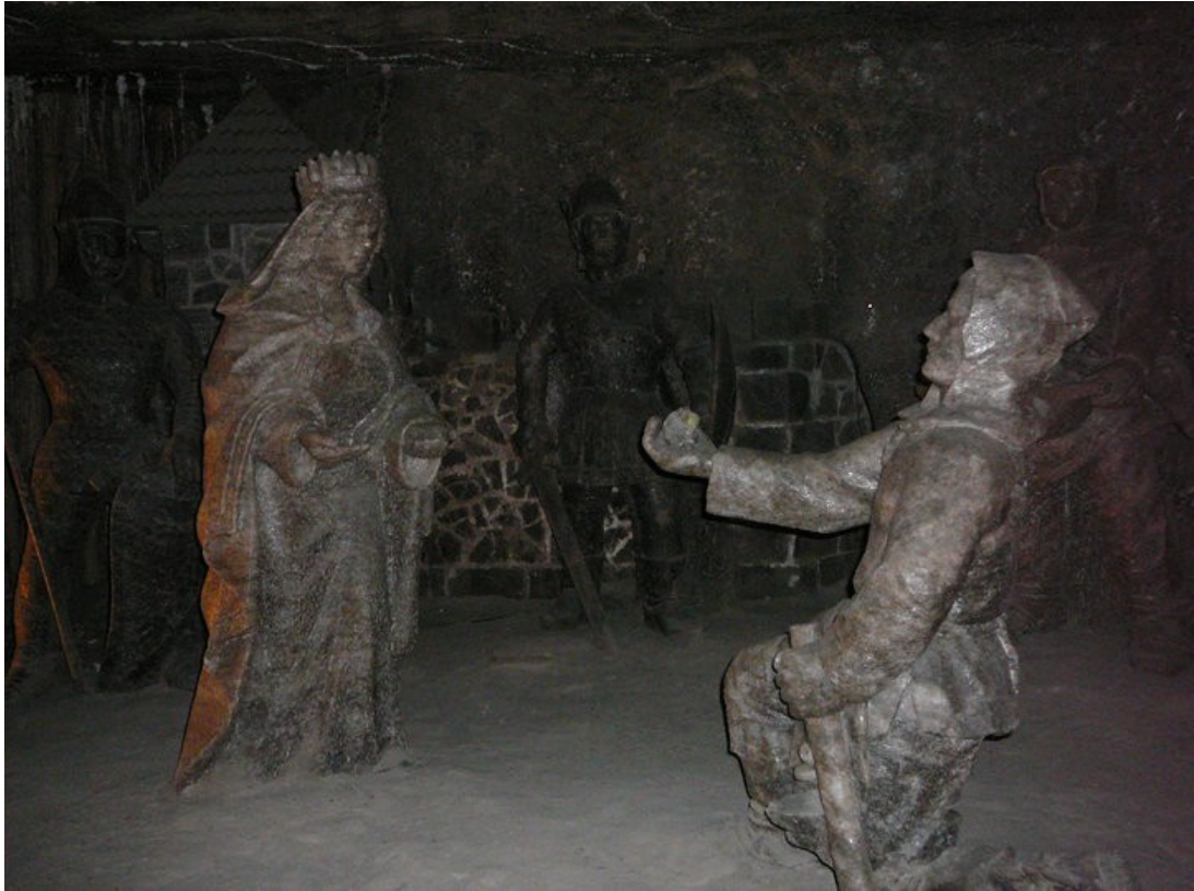
Wieliczka-solné doly-královna a horník