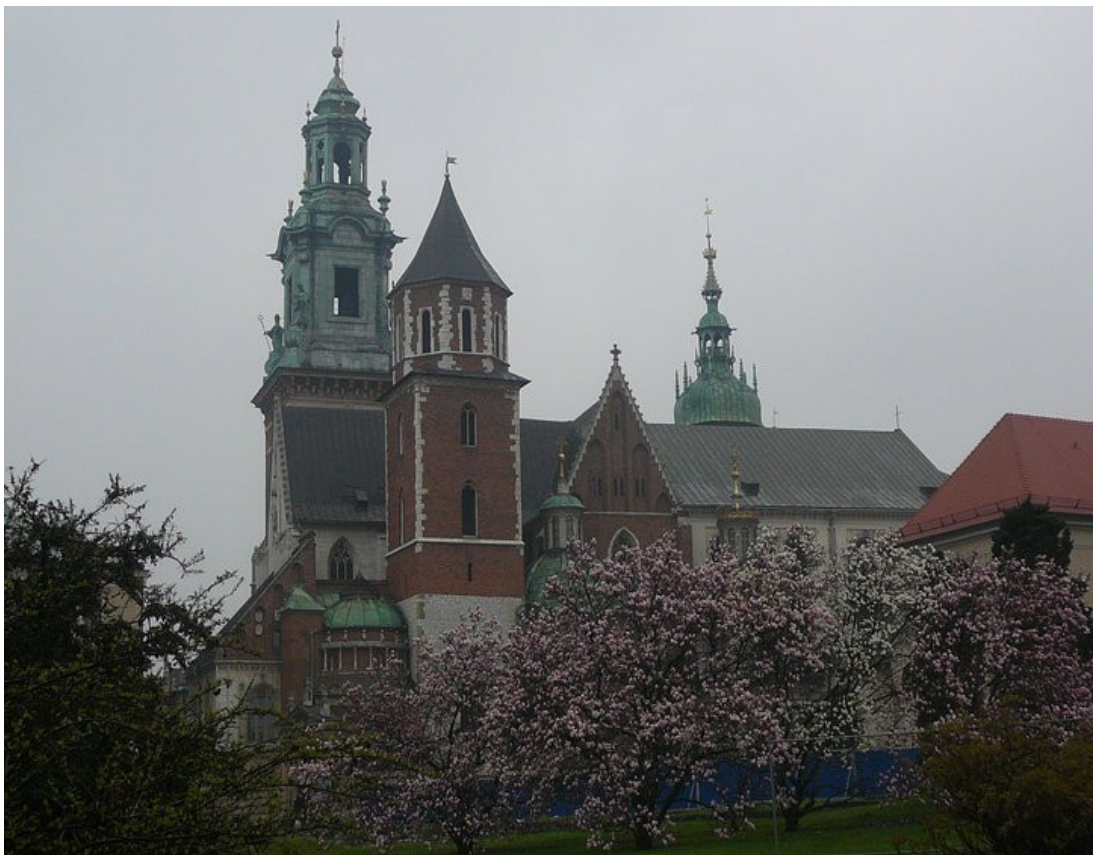
nádvoří hradu Wawel