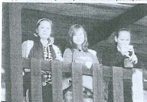
Tři „Júlie“ na balkóně. ☺