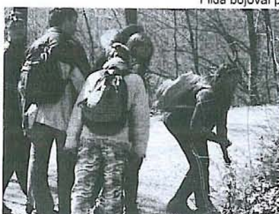
Kika nasla ještěrku.