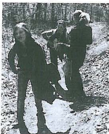
Holky supí do kopce.

V sobotu o velikonočních prázdninách si hrstka šestáků s paní učitelkou vyšlápla na malý výlet. Za slunečného, i když dosti chladného počasí se šestáci rozhodli dobýt Nový hrad. Protivníkem při útoku na hrad tentokrát byla vlastní špatná kondička po lenošivé zimě, bříška plná prázdninových dobrot od maminek, těžká svačina v batůžku a adamovské kopce.