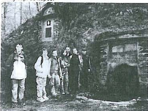
Tady jsou všichni dobyvatelé ještě s úsměvem pod kopcem.