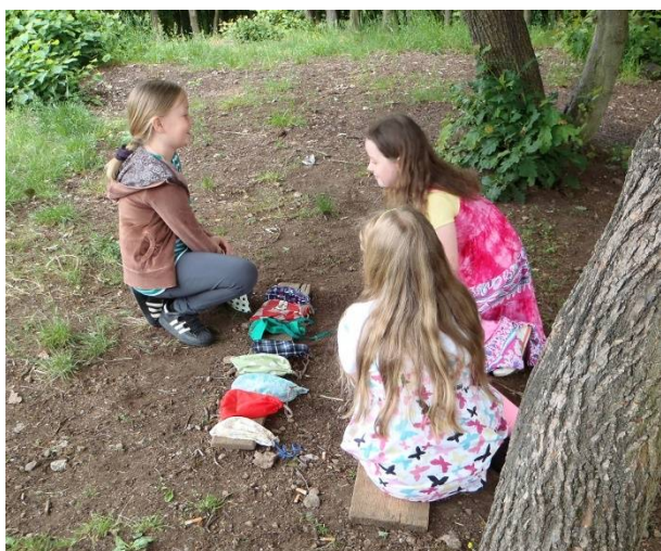
Fotky ze Dne dětí (viz str. 17)