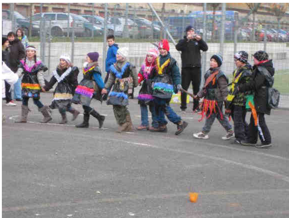
Žáci 3. B

Poslední únorový den se v Adamově konal masopust. A naše třída přece nemohla chybět. Ve škole jsme si vyrobili masky z našeho oblíbeného materiálu – odpadkových pytlů, ozdobili je krepáky, v pase převázali stužkou a na čepici přilepili pérka a už byli na světě skvělí indiáni. První místo za kolektivní masku nás tedy opět neminulo. Všichni jsme si páteční odpoledne náramně užili a těšíme se na další masopust.