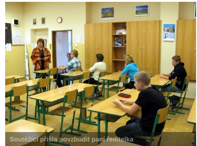
Soutěžící přišla povzbudit paní ředitelka