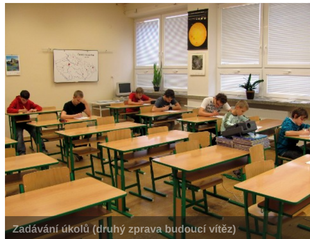
Zadávání úkolů (druhý zprava budoucí vítěz)